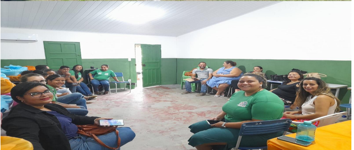
Atividades: Rede Socioassistencial pública de Belmonte e Conselho Tutelar / Torneio Dia da Mulher