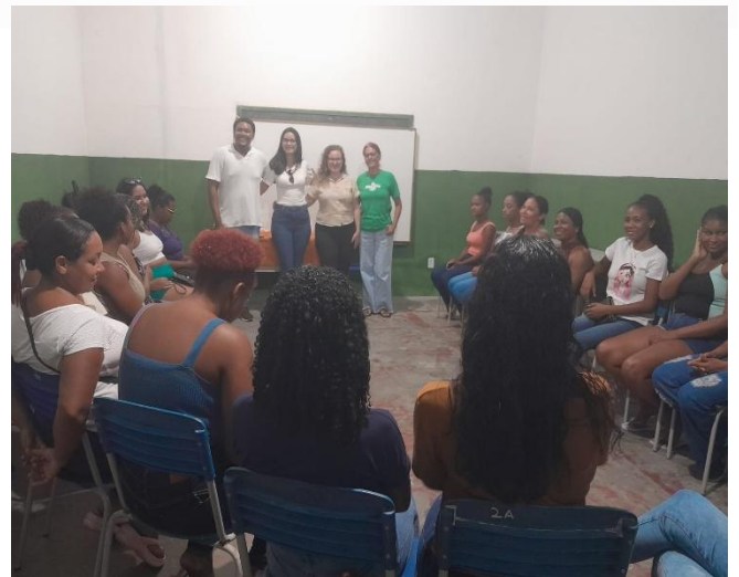
Atividades: Jornada do SUAS 2024 / Benefícios Socioassistenciais