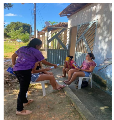
Atividade: Campanha Faça Bonito 2024