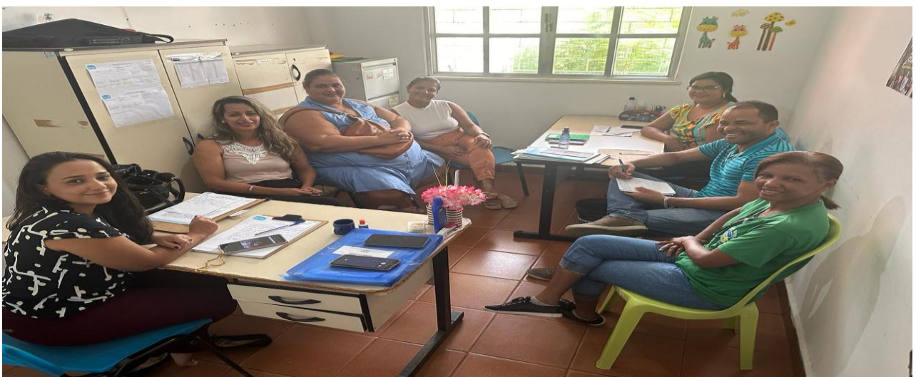
Atividades: Proteção Social Especial / CREAS / Campanha Disque 100